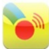
Scene and Heard